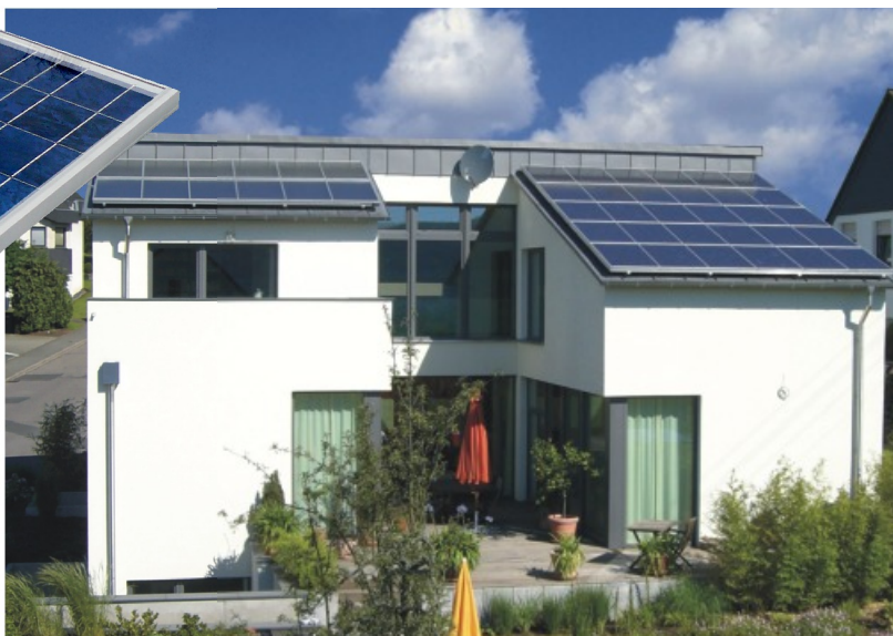
Passivhaus in Trier Strom und Wärme von der Sonne: rechts 5,4 kWp SolvisPico (Sonnenstrom), links 16 m 2 SolvisFera (Wärmekollektor), Aufdach-Montage